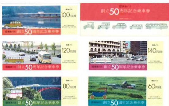
阪急バス創立50周年記念乗車券

これまでに個人・法人から約2万点の資料をご寄贈頂き、順次、整理・登録の上、保存を進めております。