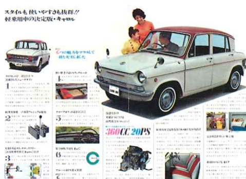
「マツダキャロル360」パンフレット