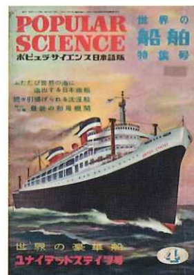
ポピュラーサイエンス 日本語版船舶特集号