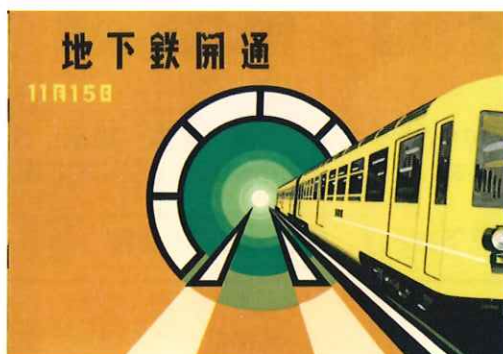
名古屋市営地下鉄開通記念パンフレット